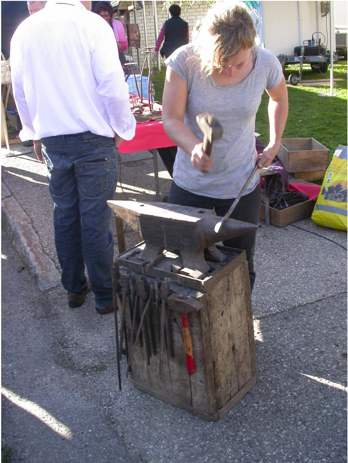
De la poigne, de l'habileté et de l'imagination.