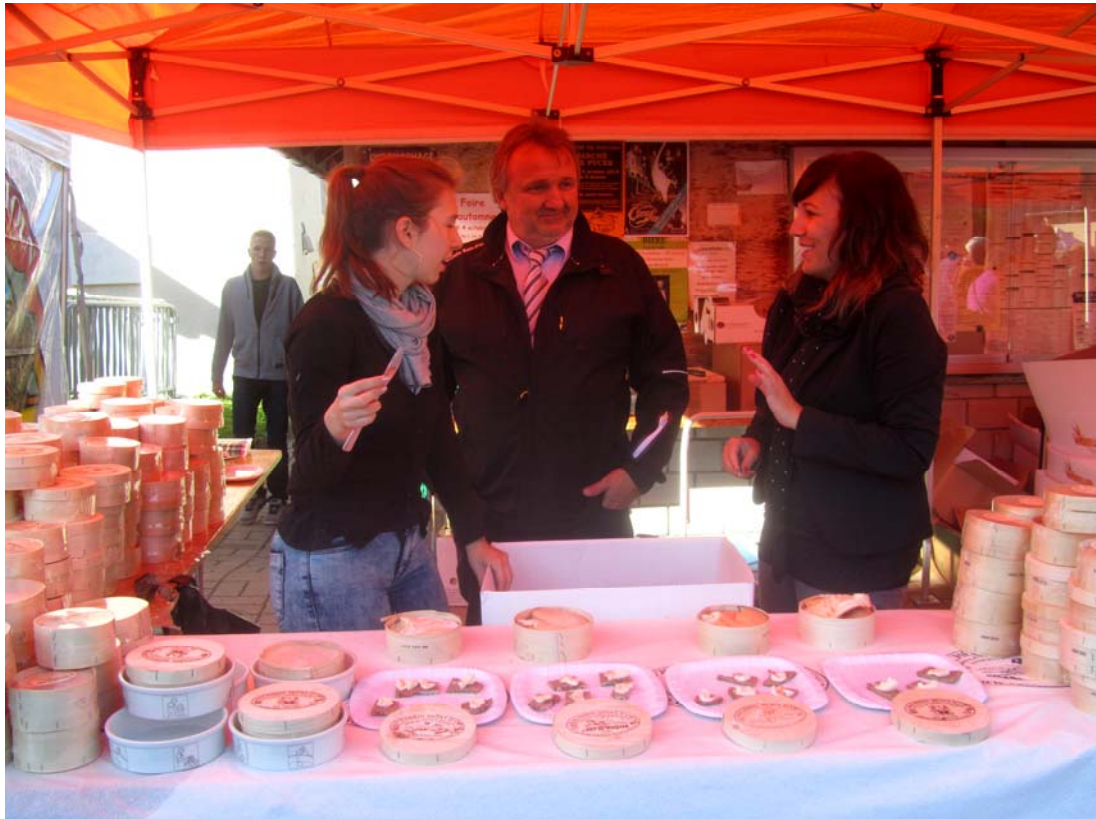
Stand du vacherin Mont-d'Or, avec son gérant et deux jolies vendeuses.