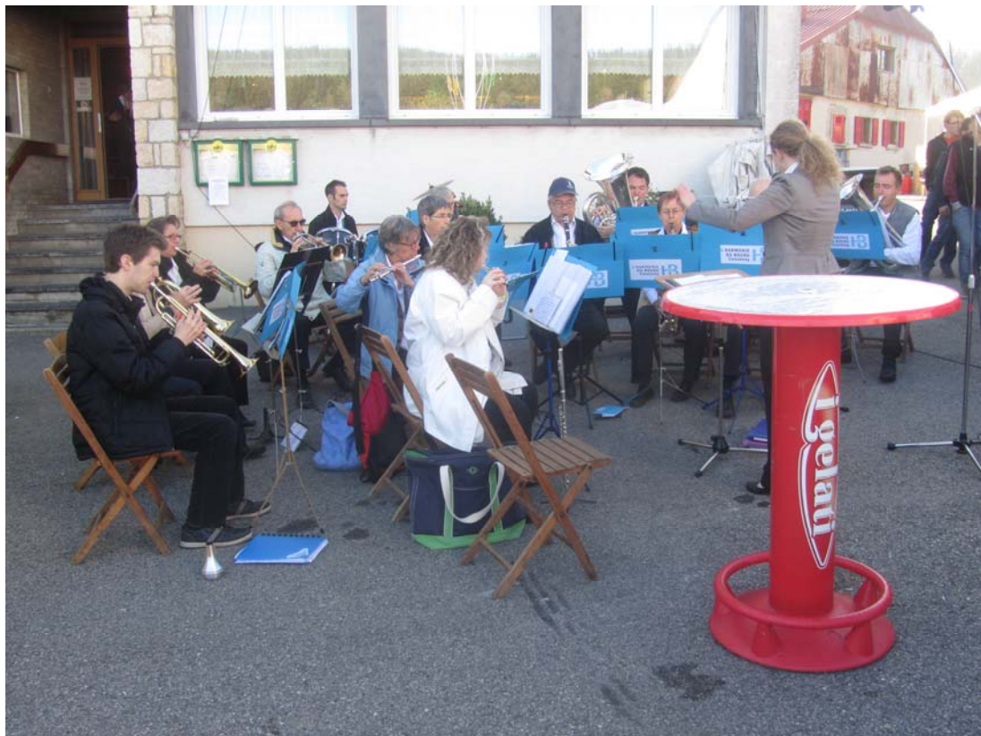
Une petite fanfare vous met le cœur en fête.