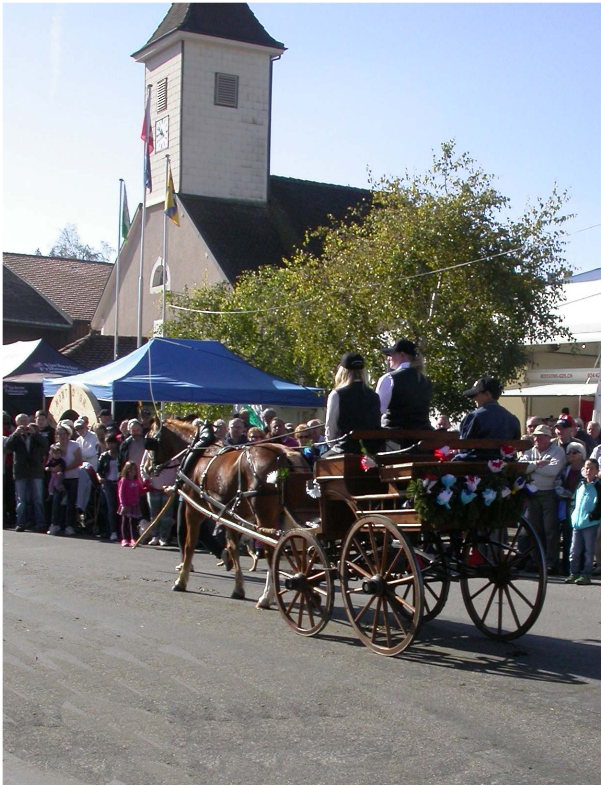
Un char a passé...